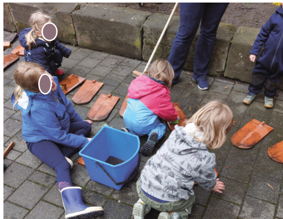
Selbst die Kleinsten wurden zur Vorbereitung des Tags der offenen Baustelle herangeholt. Hier beim Reinigen der Dachziegel. (Tststst Kinderarbeit - die Lektorin)