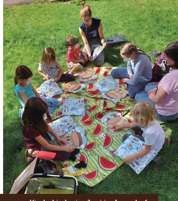
Kinderkirche im Juni im Innenhof