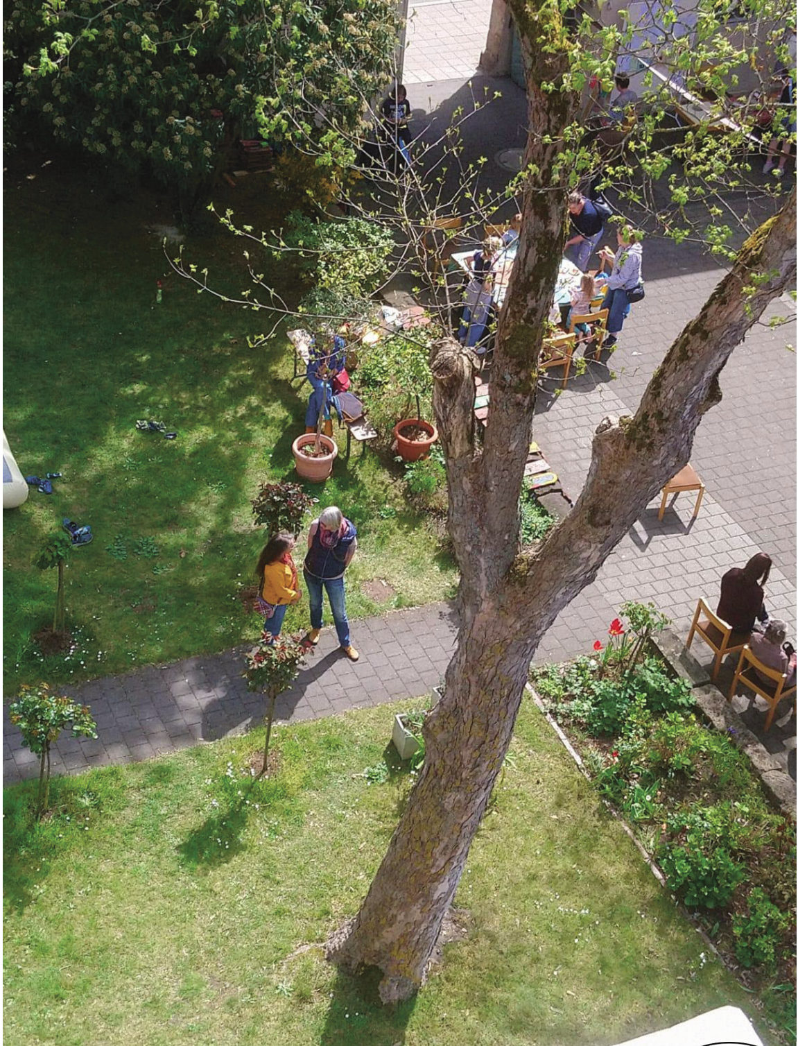
Blick vom Dachstuhl am Tag der Offenen Baustelle, 26. April